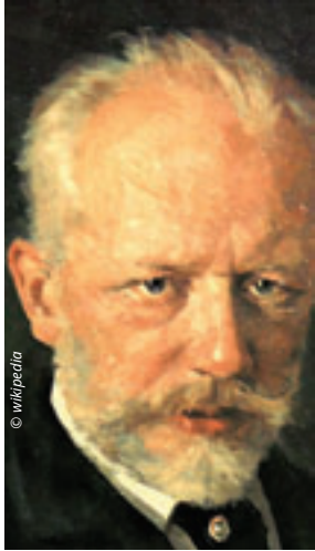
Peter Iljitsch Tschaikowsky

"Ich bin hier sehr, sehr einsam, und wäre nicht die ständige Arbeit, dann würde ich in Melancholie verfallen. Und auch das ist richtig, daß die verfluchte Homosexualität zwischen mir und den meisten Menschen einen unüberschreitbaren Abgrund bildet", léisst de Klaus Mann de Peter Iljitsch Tschaikowsky a sengem Roman Symphonie pathétique soen.