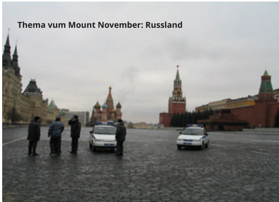
Thema vum Mount November: Russland