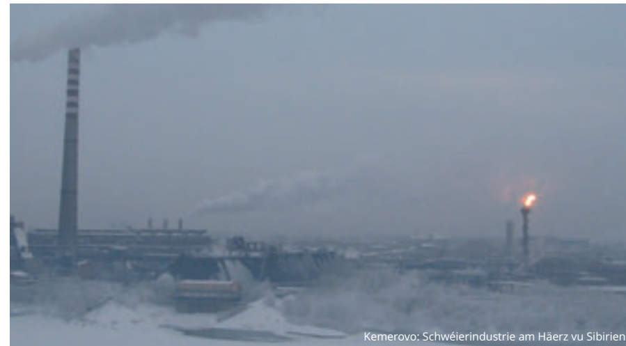
Kemerovo: Schwéierindustrie am Häerz vu Sibirien

Eigentlech gehéiert hien an d'Galerie vun de grouse Pianisten aus der Jazzgeschichte. Hie bestécht duerch fulminant Unisono-Passagen tëscht deenen zwou Hänn, en ausgefeilte Be-Bop-Language oder halbsbriechesch Tempi. Entdeckt e puer wichteg a representativ Opname vum Phineas Newborn Jr.