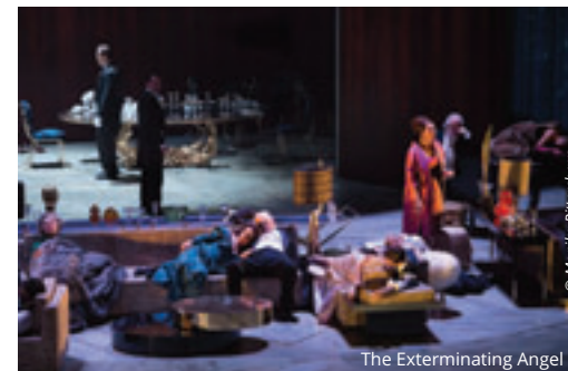
The Exterminating Angel