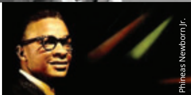
Phineas Newborn Jr.