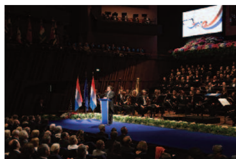
Retransmission de l'acte civil à la Philharmonie lors de la Fête nationale

Au cours de l'exercice 2015, radio 100,7 a sensiblement augmenté le nombre de ses transmissions en direct, dans le contexte d'événements anniversaires ou artistiques.