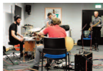
Jazz Jamming Session au studio

radio 100,7 a poursuivi ses partenariats avec les festivals de musique majeurs au Luxembourg : Rencontres musicales de la Vallée de l'Alzette, Soirées musicales de Bissen, Festival de Bourglinster, De Klänge Maarnicher Festival, Musek am Syrdall, Festival d'Echternach, Festival de Wiltz, Festival international de musique d'orgue Dudelange.