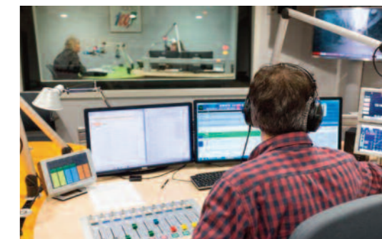
Regard derrière les coulisses de radio 100,7

Sur l'année 2015, le taux de disponibilité technique de la radio 100,7 atteignait 99,97%.